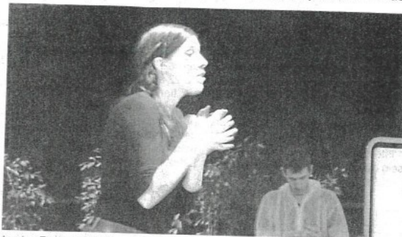
Le duo Foutu quart d'heure a su parler de sexualité avec les adolescents du collège et du lycée.

Les ados ont assisté à un spectacle pour parler du sida